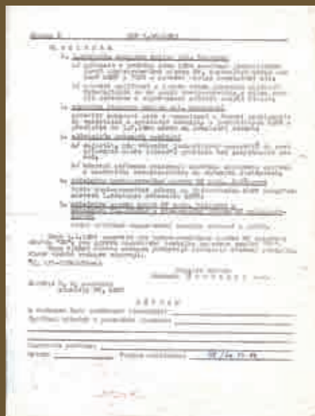
dokument č. 5 - kopie organizace II. správy z roku 1965