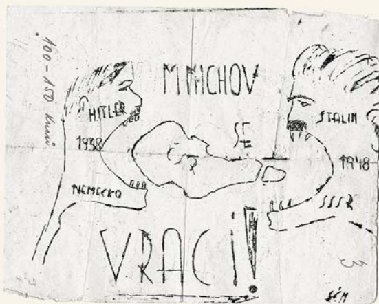
Ilegální leták zabavený Státní bezpečností (ABS)

Dějiny 20. století přinesly nejen rozvinutí mnoha vymožeností moderní civilizace, ale také opakovaně ohrožení základních lidských práv a hodnot. Zvláště destruktivně v celosvětovém měřítku se přitom projevil nacismus a komunismus jako politická hnutí a režimy zaměřené systematicky na duchovní podrobení jedince. Přitom se ukázalo, že po likvidaci demokracie a občanských práv přišly zejména za vlády komunistů na řadu v rámci manipulace s lidmi tradiční základní hodnoty spojené s křesťanstvím. Totalitní režimy si kladly za cíl proniknout – obrazně řečeno – až do duše obyvatel a prosadit tím definitivně svou despotii.