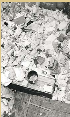
Útok proti klášterům znamenal rovněž nevratné kulturní ztráty (klášter Kadaň, 1950)

Jeho součástí byla násilná izolace biskupského sboru od věřících, uvěznění či internace biskupů, přerušování diplomatických styků s Vatikánem a politické monstrprocesy. V prvním z nich byli souzeni představitelé mužských řeholí a katolictví teologové a byl doprovázený propagandistickou kampaní