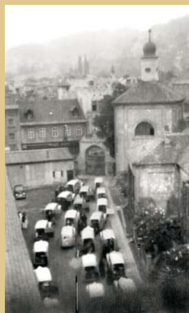
Odsun Milosrdných sester sv. Kříže z Bohosudova do Vidnavy, 1951

líčící kláštery jako špiónážní centra připravující se na ozbrojený boj. Celkově bylo v českých zemích do roku 1968 odsouzeno 355 řeholníků na 2 106 let a 1 měsíc, třikrát byl vynesena rozsudek doživotí.