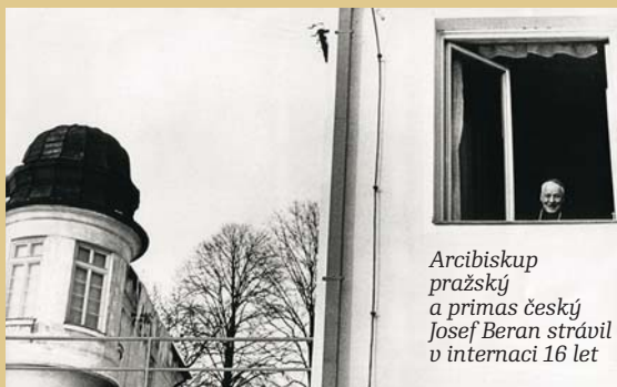
Arcibiskup pražský a primas český Josef Beran strávil v internaci 16 let

Pro československé komunisty představovala zásadní překážku pro totalitní režim římskokatolická církev, která se v podmínkách pounorového Československa vlastně ocitla v postavení zajatce. Věřící i kněží žili v režimu, který proti nim v podstatě vedl zákeřný vícegenerační boj. V tomto zápase krivícím charaktery se pouze měnily prostředky nátlaku ze strany režimu. Ačkoli se tato složka novověkých českých dějin týkala velkého množství lidí a zanechala mnoho morálních a materiálních škod, nebyla veřejností po roce 1990 ještě komplexnějším způsobem doceněna a reflektována. Cílem výstavního projektu je proto představit odborné a laické veřejnosti hlavní specifika proticírkevního boje komunistického státu, přiblížit analytickým historickým způsobem hlavní rysy nátlaku a vytvořit tak rámec pro hlubší reflexi našich nedávných dějin.