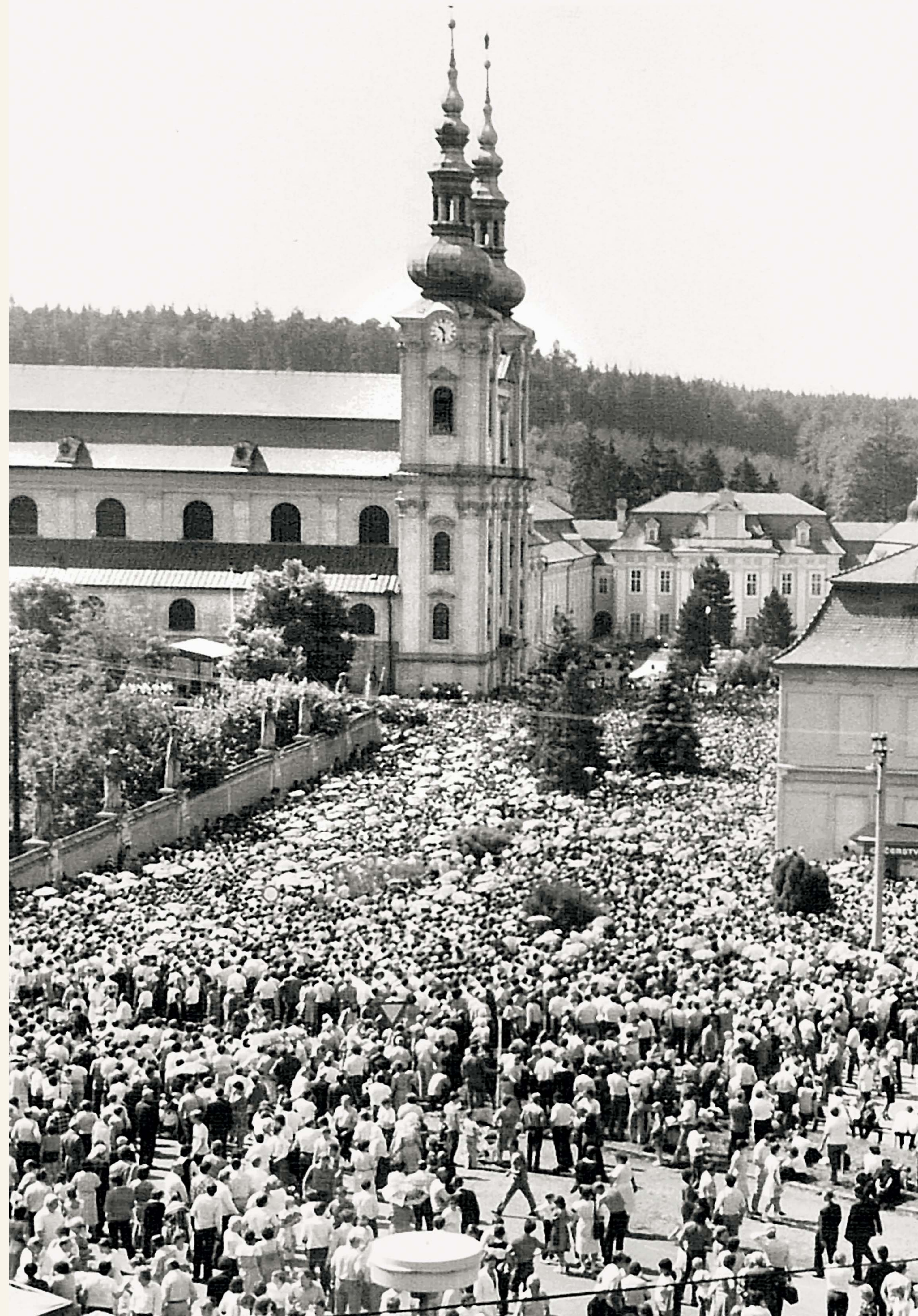
Poutních slavností v červenci 1985 se, přes překážky kladené komunistickým bezpečnostním aparátem, zúčastnilo na 200 000 věřících, převážně mladých lidí (dle policejních odhadů až 60 % účastníků bylo mladších 25 let), kteří jasně vyjádřili své požadavky náboženské a občanské svobody. K nejčastěji opakovaným skandovaným heslům patřily „Papež do Prahy“ a „Náboženskou svobodu“. Věřící s jásotem přivítali českého primase kardinála Františka Tomáška, který přečetl apoštolský list Jana Pavla II. a uvedl papežského legáta kardinála Agostina Casarolimo. Ten sloužil mši střídavě v češtině a slovenštině. Soukromý archiv M. Bláhové (foto František Bláha)

Roli Velehradu při pádu železné opony podtrhl svou návštěvou papež Jan Pavel II. 22. 4. 1990. Ve své homilii dále mj. uvedl: „Úhelný kámen evropské jednoty nalézáme zde na Velehradě (stejně jako třeba Monte Casino, odkud svatý Benedikt budoval Evropu latinskou), kam soluští bratři natrvalo vstúpili do dějin Evropy tradicí řeckou a byzantskou. Tyto dva obrovské vklady, obě tradice, byt jsou odlišné, patří k sobě. Společně tvoří křesťanskou Evropu – někdejší i současnou.“ NA (ÚPV, oficiální logo návštěvy)