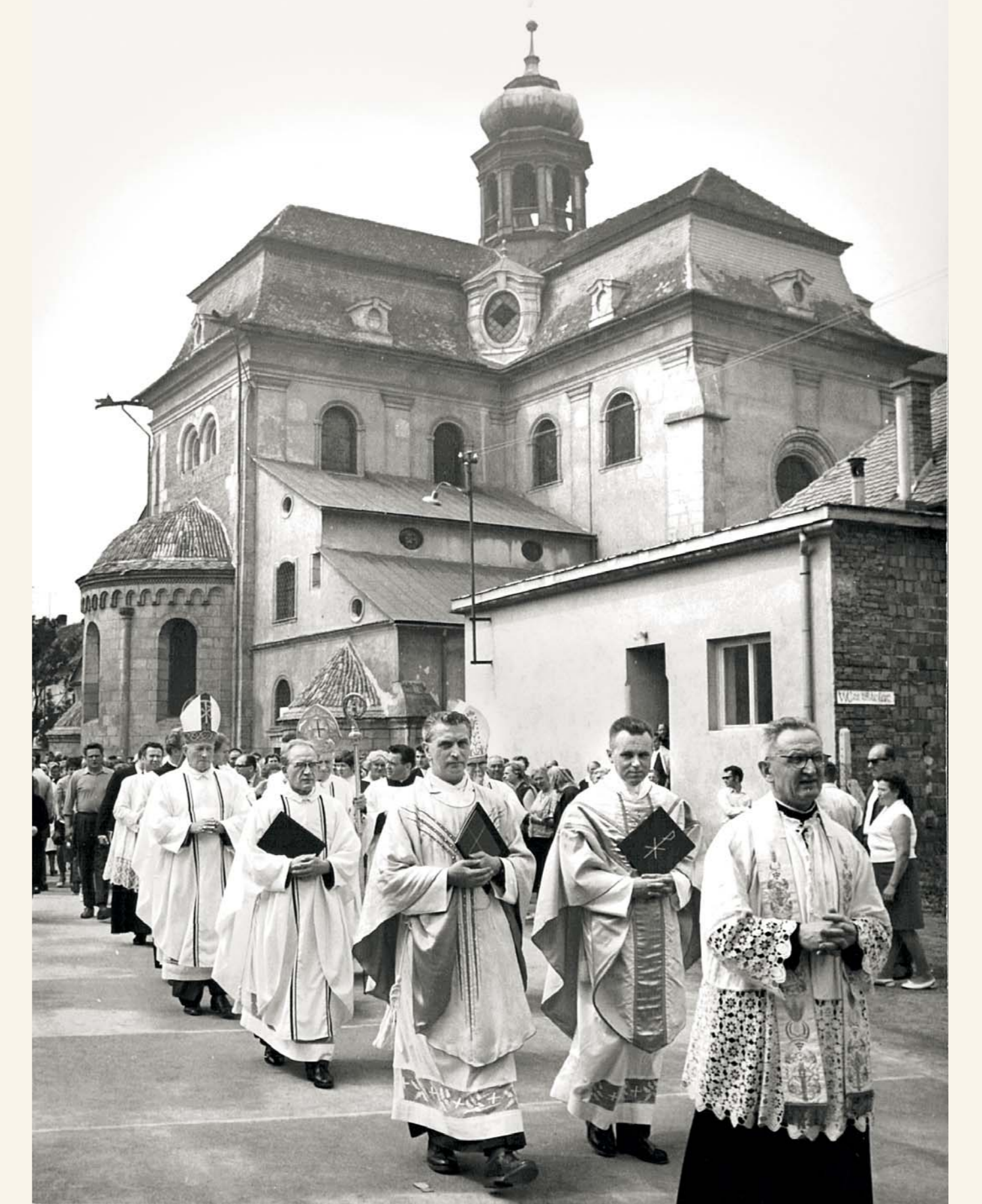
Jubilejní rok úmrtí sv. Konstantina - Cyrila - 869 - 1969

Oficiální řečníky, prezentující pouť jako „mírovou slavnost“, poutníci vypískali. Během jejich projevů rovněž skandovali hesla o potřebě skutečné náboženské svobody a např. ministra kultury hlasitě nabádali, aby v souvislosti s věrozvěsty užíval označení „svatí“. Komunistická moc byla zcela zaskočena. Z organizace „akce“ tradičně obvinila nelegální církev, opoziční hnutí Charta 77 a „zahraniční ideodiverzní centra“. Pro církev byla významným přelomem – obnově sebevědomí a vědomí síly předznamenalo její aktivnější vystupování v roli opozice (mj. příprava duchovního programu, kterým chtěla oslovit širokou veřejnost, např. Desetiletí duchovní obnovy v r. 1987). Poutě, na jejímž význění měli velkou zásluhu podzemní církev a aktivisté z řad laiků, ovšem aktivizovala všechny oblasti církevního života. Charakteristickým rysem byla i vzrůstající činnost ve sféře katolického samizdatu a zintenzivnění spolupráce neoficiální církve s protivládními občanskými iniciativami. A zejm. mezi mládeží narůstalo hledání spirituálního rozměru života. RKF Velehrad