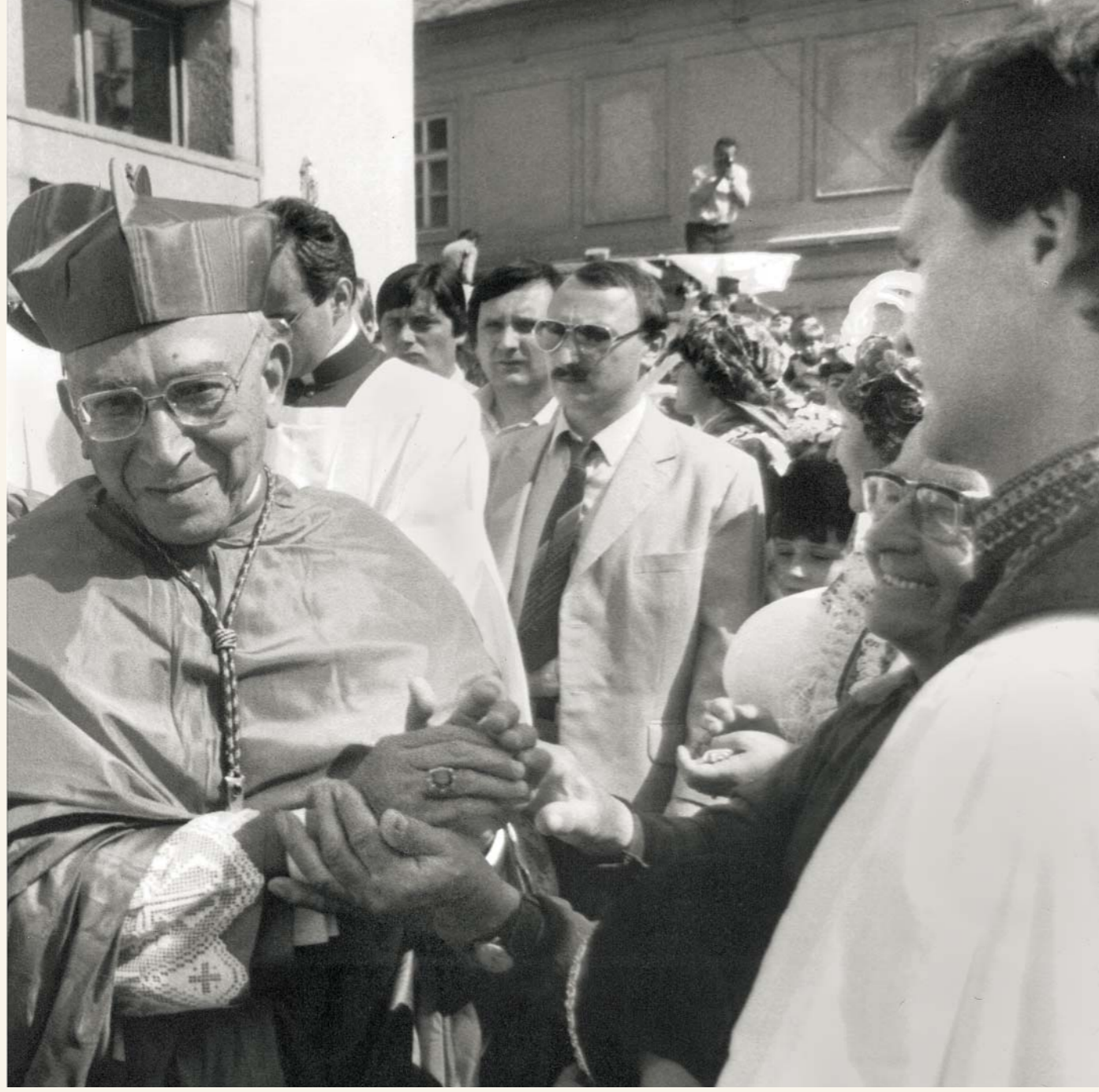
A. Casarolimu byl, ve snaze izolovat ho od církve a věřících, stanoven závazný oficiální program. Přesto se mu podařilo setkat s kardinálem Tomáškem a diskutovat s kněžími. Později se svěřil, že až na Velehradě poznal, v jak těžké situaci se církev v Československu nachází. Své zážitky z Velehradu, z projevu víry žité a životně, shrnul slovy: „Vzpomínka na ony dny mě provázela a provází jako jedna z nejlepších chvil mého života.“ RKF Velehrad (foto z oficiálního přivítání A. Casarolimo na Velehradě r. 1985)

Jedním z ústředních míst paměti spojené s cyrilometodějskou úctou byl a zůstává Velehrad. Od oslav milénia příchodu misie na Velkou Moravu (1863) roste význam této svatyně nejen pro české země, ale i z evropského hlediska (od té doby se také svátek obou evangelizátorů slaví 5. 7.). Nadnárodní přesah dokumentují např. unionistické sjezdy, které se zde konaly od roku 1907 s cílem rozvíjet duchovní dialog mezi křesťanským Východem a Západem. Tyto akce se těšily také podpoře ze strany Vatikánu a v roce 1928 byl velehradský chrám poctěn titulem basilica minor.