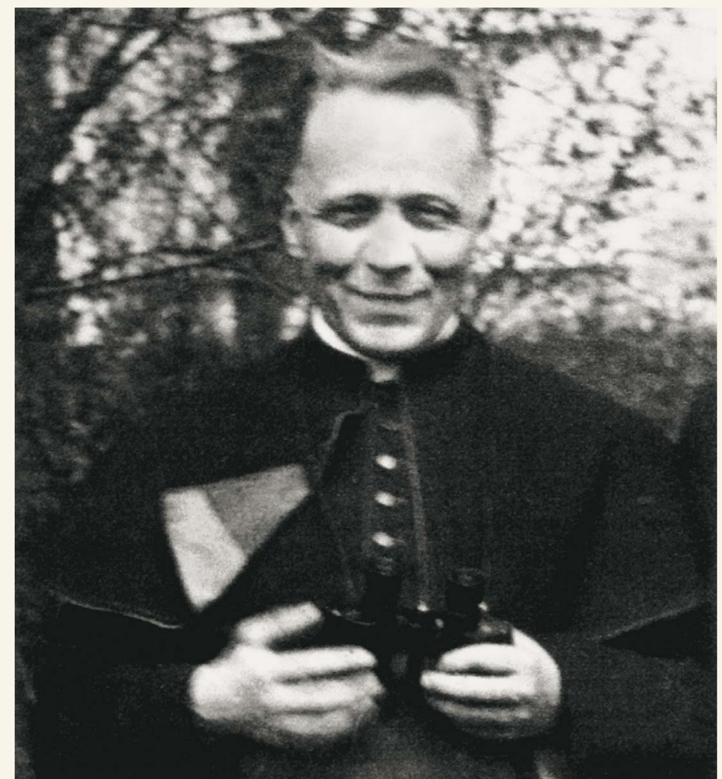
Krátce před zatčením gestapem v roce 1942.