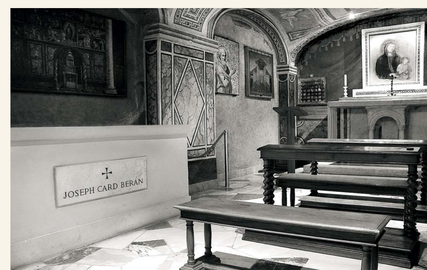
Komunisté nedovolili převoz Beranových ostatků do Prahy. Papež Pavel VI. rozhodl, že kardinál bude pohřben mezi papeži v bazilice sv. Petra v Římě.