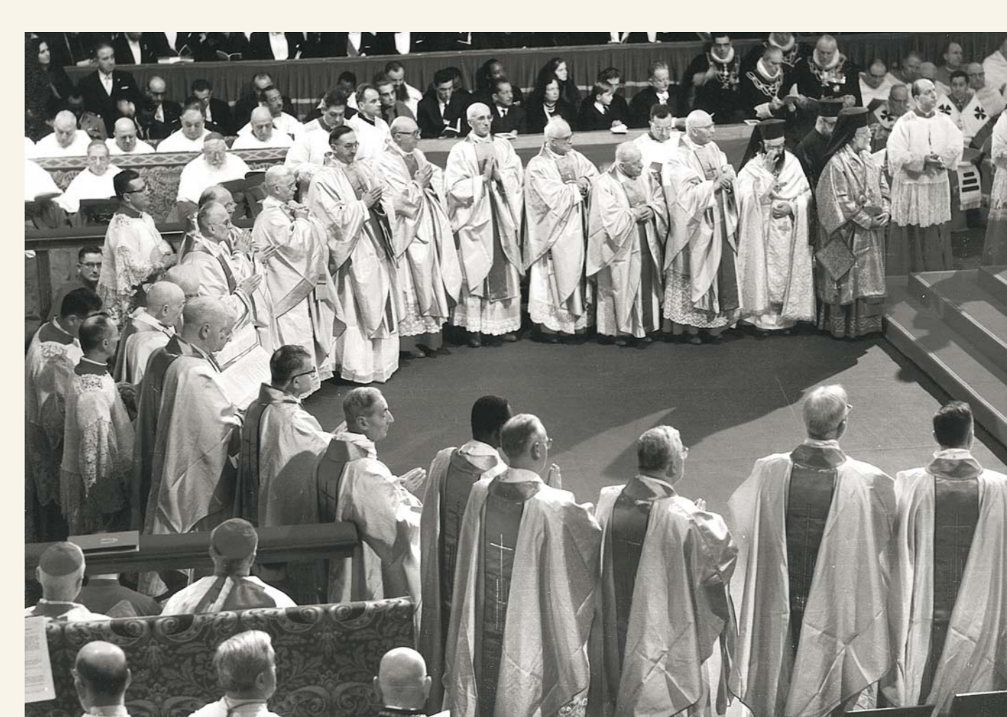
Společně s dalšími 26 novými kardinály převzal insignie své hodnosti také pražský arcibiskup Josef Beran.