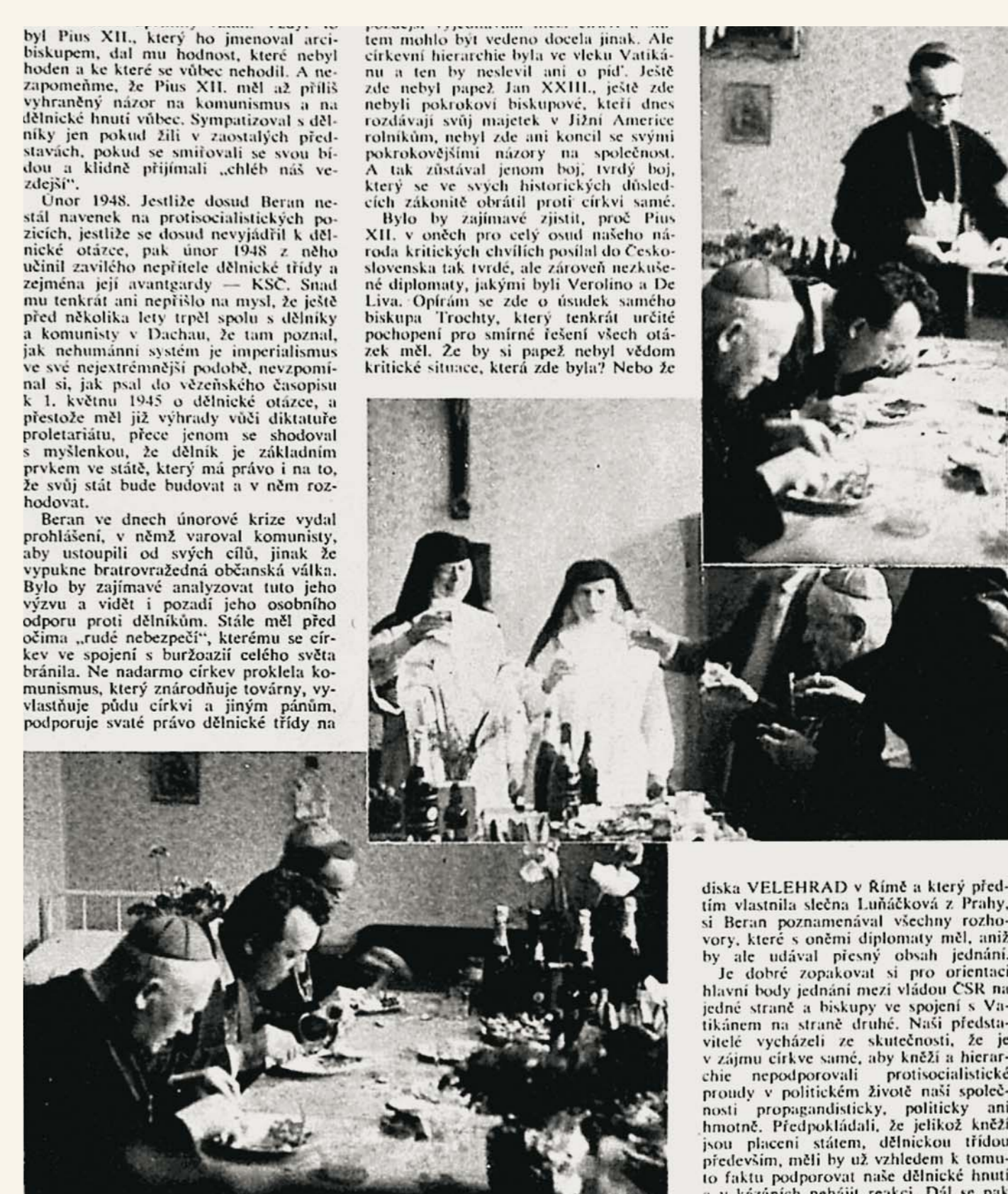
Fotografie pořízené StB při sledování arcibiskupa Berana v internaci se později objevily v časopise Květy jako součást pomlouvácké kampaně vedené československou rozvědkou proti kardinálu Beranovi.