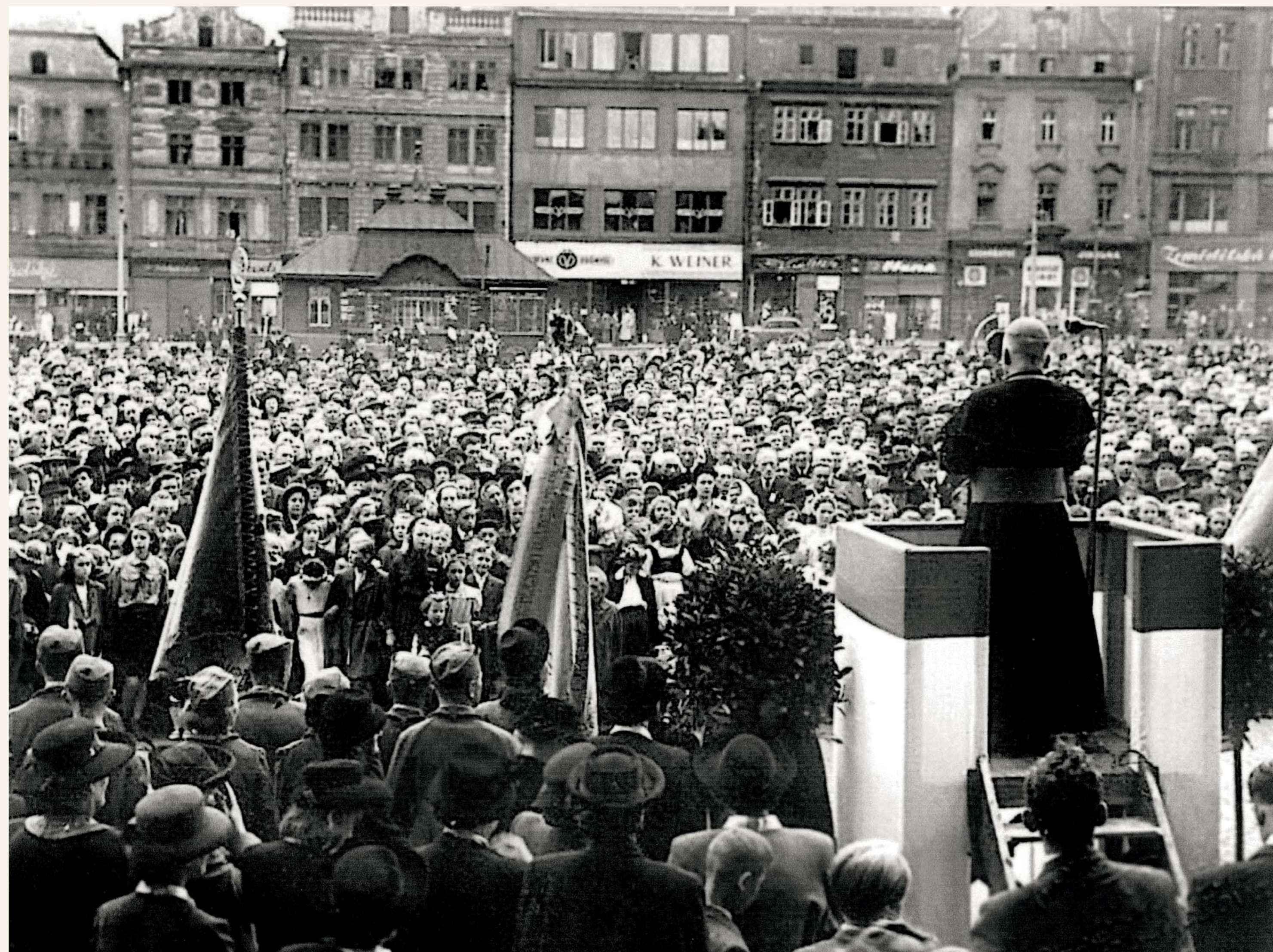
Arcibiskup Beran po svém nastolení podnikl mnoho cest po celém Československu. Dne 8. května 1947 přijel také poprvé ve funkci arcibiskupa do rodné Plzně. Jeho projev o potřebě návratu ke křesťanským hodnotám, usmíření, spolupráci a solidaritě ve všech vrstvách společnosti poslouchalo zaplněné náměstí.