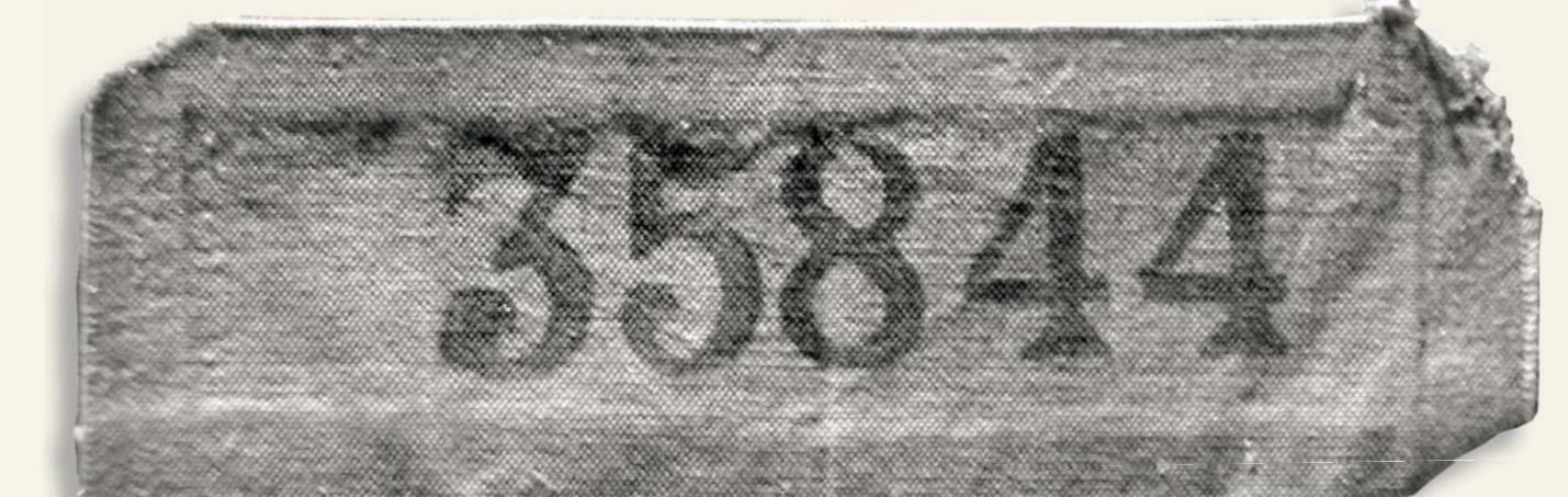
Transport s Beranem dorazil 4. září 1942 do koncentračního tábora Dachau. Zde byl zařazen do kategorie politických vězňů s číslem 35844.