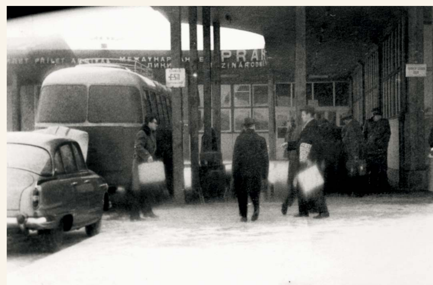
Snímky pořízené StB při tajném sledování odjezdu arcibiskupa Berana do Říma v únoru 1965.