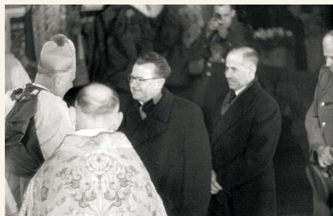
Předseda vlády Klement Gottwald blahopřeje arcibiskupu ke zvolení.

Za vlády komunistů prožil Josef Beran tvrdou šestnáctiletou internaci. Podmínky internace se podobaly vězeňskému režimu, ale navíc obsahovaly úplnou izolaci od vnějšího světa. Arcibiskup neznal místo svého pobytu, neměl spojení s rodinou, byl mu odírán i komunistický tisk, takže mnoho let nevěděl, jestli církev ve státě ještě vůbec existuje. Netušil, jak dlouho internace potrvá, zda bude souzen v některém z inscenovaných procesů nebo jej „odstraní“ a rodině sdělí, že zemřel „přirozenou“ smrtí. Casem se internace zmírnila, ale stále na vykázaném místě a pod přímou kontrolou StB. Snímek pochází z posledního internačního místa v Radvanově (1964).