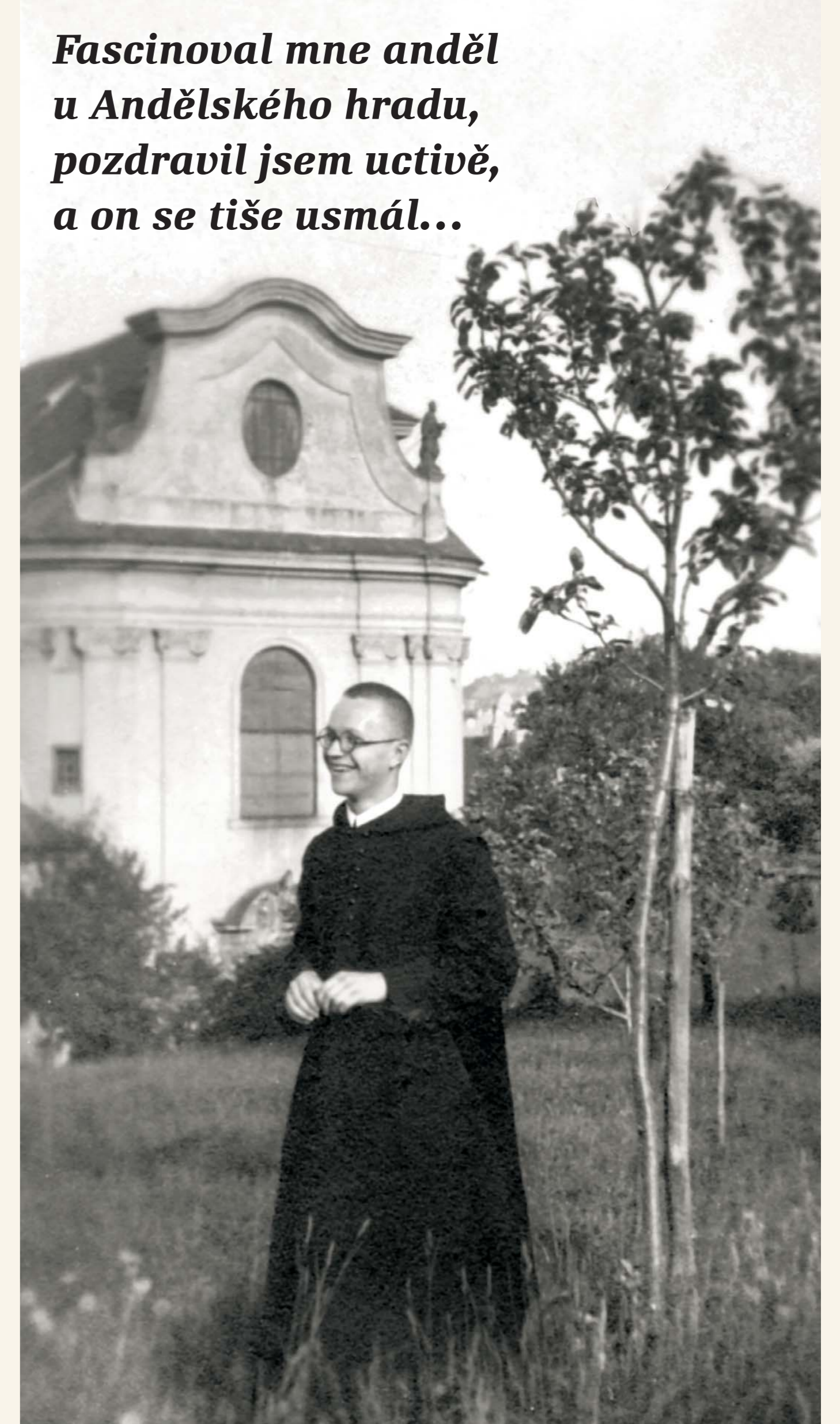
Fascinoval mne anděl u Andělského hradu, pozdravil jsem uctivě, a on se tiše usmál...