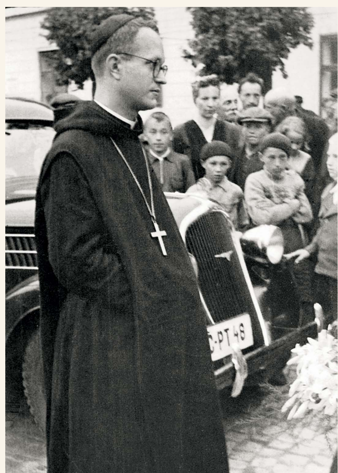
Fotografie z 2. poloviny 40. let, z doby jeho opatského působení. Opatské svěcení přijal od pražského arcibiskupa a českého primase Josefa Berana v dubnu 1947 v opatském kostele sv. Markéty v Břevnově.

Po propuštění v rámci amnestie (květen 1960) pracoval jako dělník na stavbě pražských sídlišť, v roce 1968 mu byl udělen státní souhlas k vý- konu kněžského povolání. V prosinci téhož roku odjel do exilu a pobýval poté až do roku 1990 v klášteře v bavorském Rohru, kde organizoval srazy příslušníků čs. emigrace, navštěvované lidmi nejrůznějších názorových proudů. Založil zde též katolické laické sdružení Opus bonum (1972) a publikoval, v češtině i němčině, několik sbírek meditativní poezie (např. Katakomben des Heute , Život upřen do Středu , Vyprahlá krajina ). Spolupracoval též s časopisem Nový život , vydá- vaným Českou Křesťanskou akademií v Římě, kde mj. v roce 1974 vyšla jeho sbírka Obrazy , inspirovaná zážitky z cest, zejm. z Itálie.