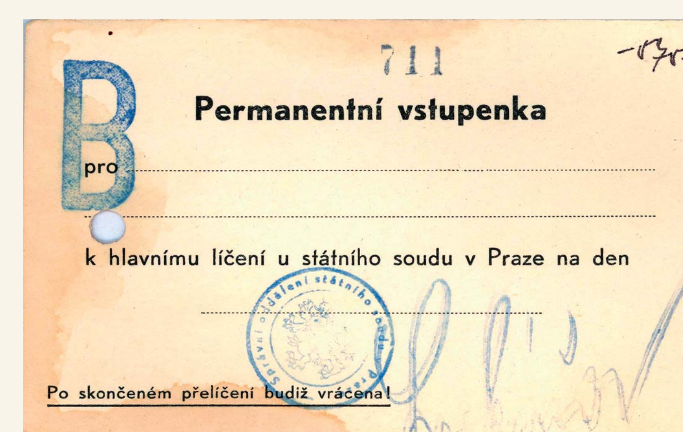
Komunistický režim připravil scénář procesu do nejmenších podrobností. Na proces byli účelově a většinou hromadně „zvaní“, resp. vysláni zástupci různých profesních skupin obyvatelstva, církve, diplomatických zastupování a vybraní novináři. K tomu účelu byly dokonce vydávány vstupenky. NA (MS)