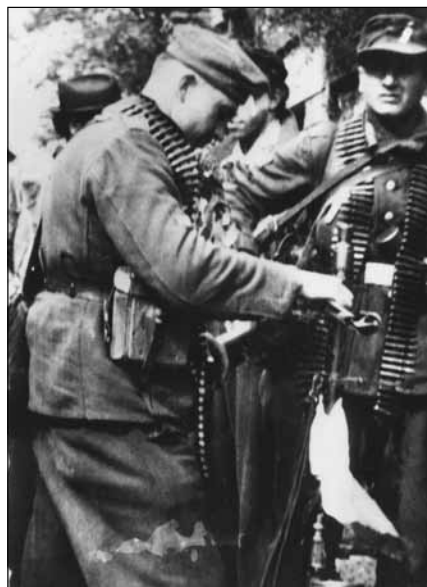
Průchod 4. pěšího pluku 1. pěší divize VS KONR Holečkovou ulicí, 7. 5. 1945