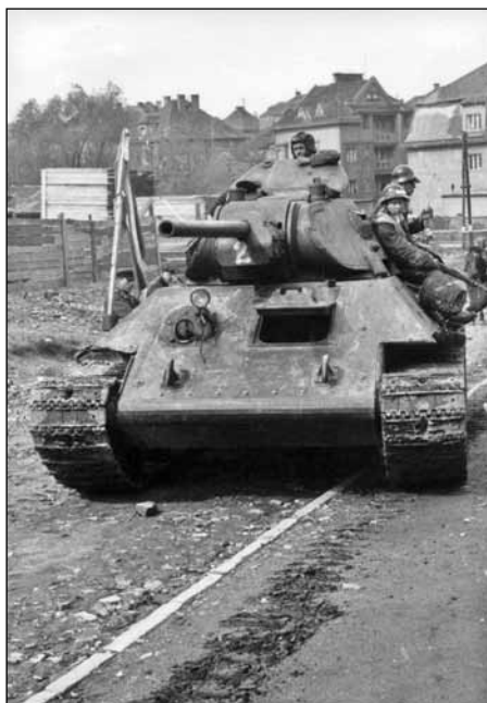
Střední tank T-34/76 samostatného průzkumného oddílu 1. pěší divize VS KONR v Praze na Pankráci, 7. 5. 1945