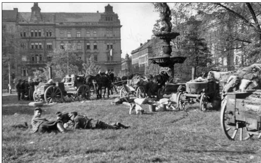
Týl 1. pěšího pluku 1. pěší divize VS KONR na Albrechtově náměstí před Štefánikovými kasárnami, 7. 5. 1945