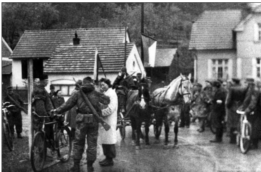
Příslušníci 1. pěšího pluku 1. pěší divize VS KONR v Zadní Třebani, 6. 5. 1945