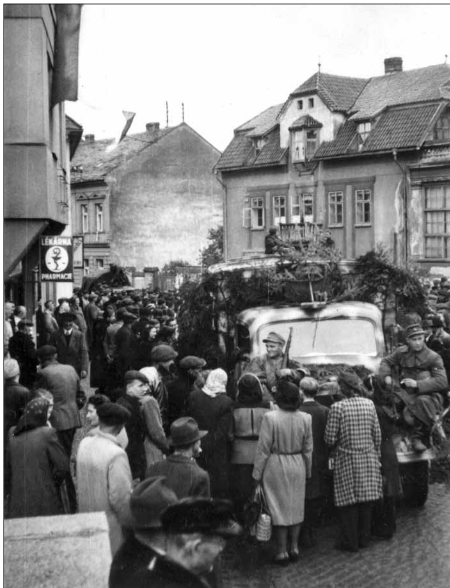
Příjezd 1. pěšího pluku 1. pěší divize VS KONR do Řevnic, 6. 5. 1945