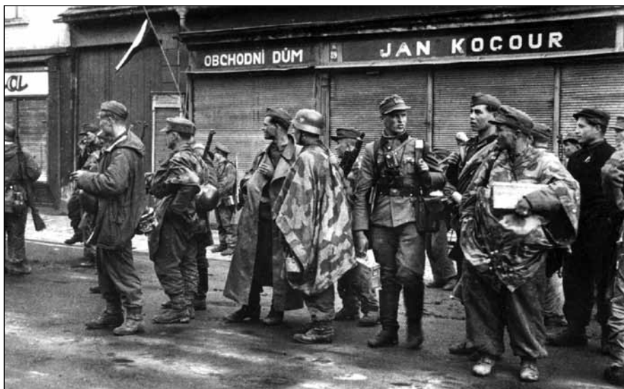
Průchod 3. a 4. pěšího pluku 1. pěší divize VS KONR Hořelicemi, 6. 5. 1945