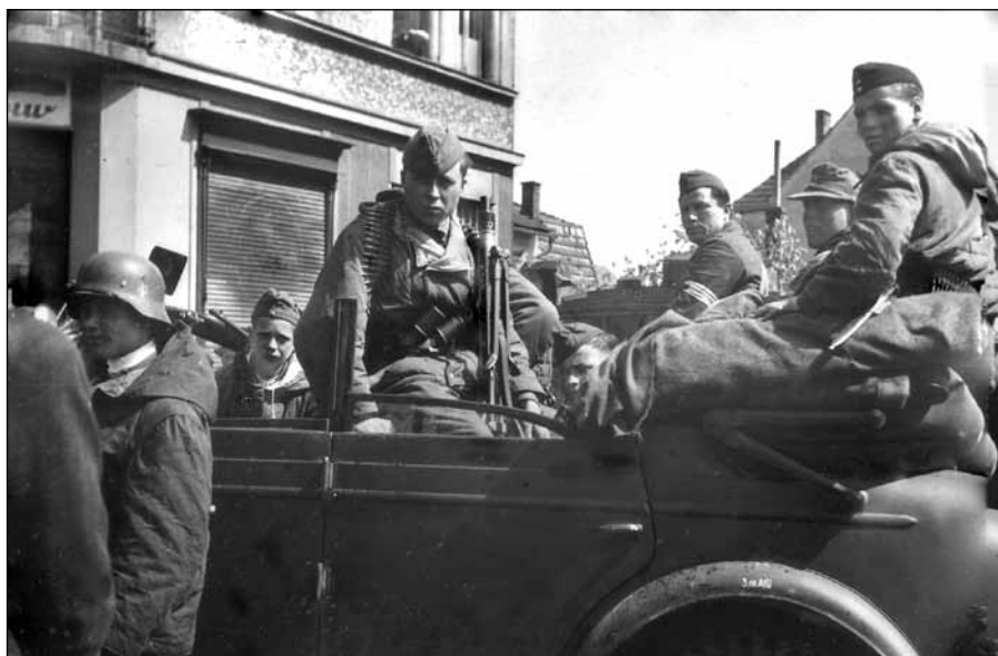
Doprovodné vozidlo samostatného průzkumného oddílu 1. pěší divize VS KONR v Radotíně, 6. 5. 1945