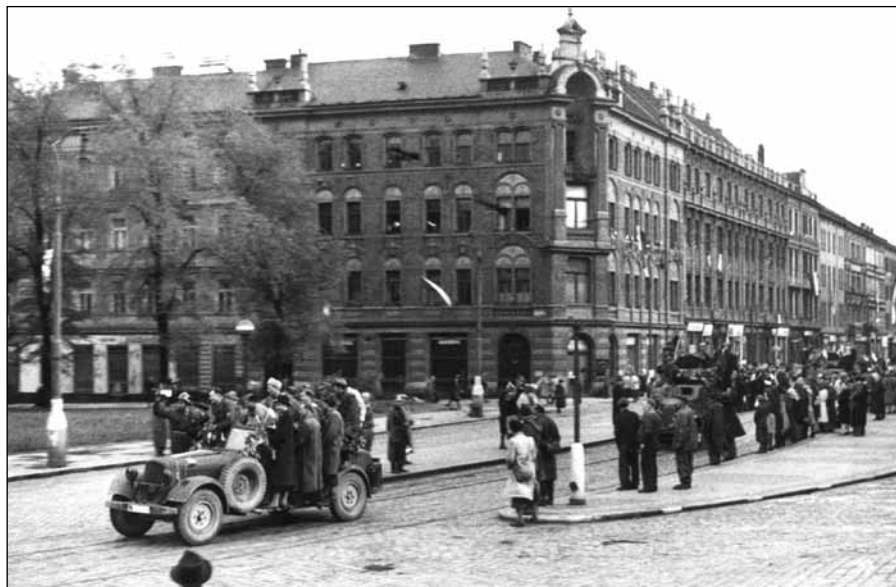
Příjezd předvoje samostatného průzkumného oddílu 1. pěší divize VS KONR ke Štefánikovým kasárnám, 6. 5. 1945