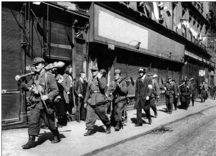
Příslušníci 4. pěšího pluku 1. pěší divize VS KONR poblíž Anděla na Smíchově, 7. 5. 1945