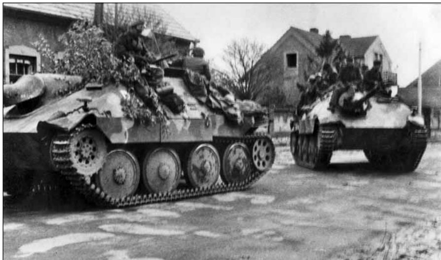
Příjezd dvou tankových stíhačů JPz 38 „Hetzer“ samostatného protiletadlového-protitankového oddílu 1. pěší divize VS KONR do Hořelic, 6. 5. 1945