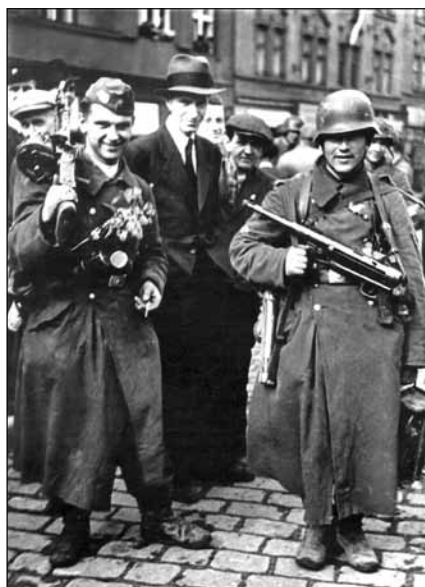
Postup 4. pěšího pluku 1. pěší divize VS KONR Plzeňskou třídou, 7. 5. 1945