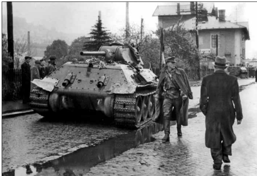
Jeden ze středních tanků T-34/76 tankového praporu samostatného průzkumného oddílu 1. pěší divize VS KONR v Radotíně, 6. 5. 1945