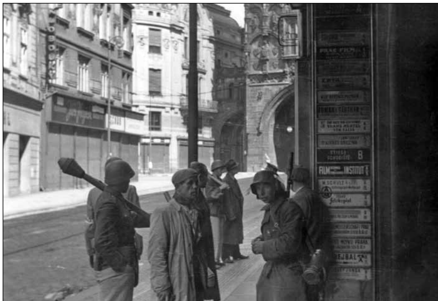
Příslušníci 1. pěšího pluku 1. pěší divize VS KONR v Celetné ulici u Prašné brány, 7. 5. 1945