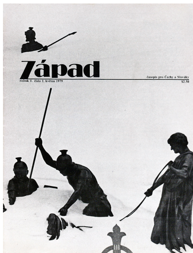
Obálky prvního a posledního čísla časopisu a speciální vydání v angličtině