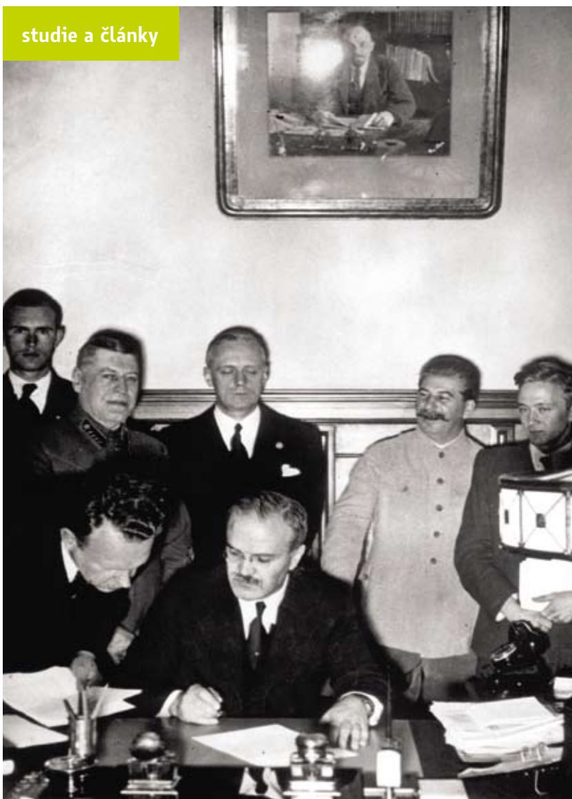
Vjačeslav Molotov podepisuje dne 23. srpna 1939 sovětsko-německý pakt o neútočení. Za ním stojí Ribbentrop a Stalin.