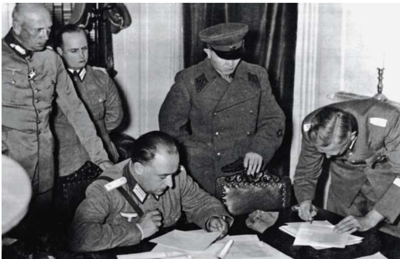
Porada německých a sovětských důstojníků u Białystoku v září 1939