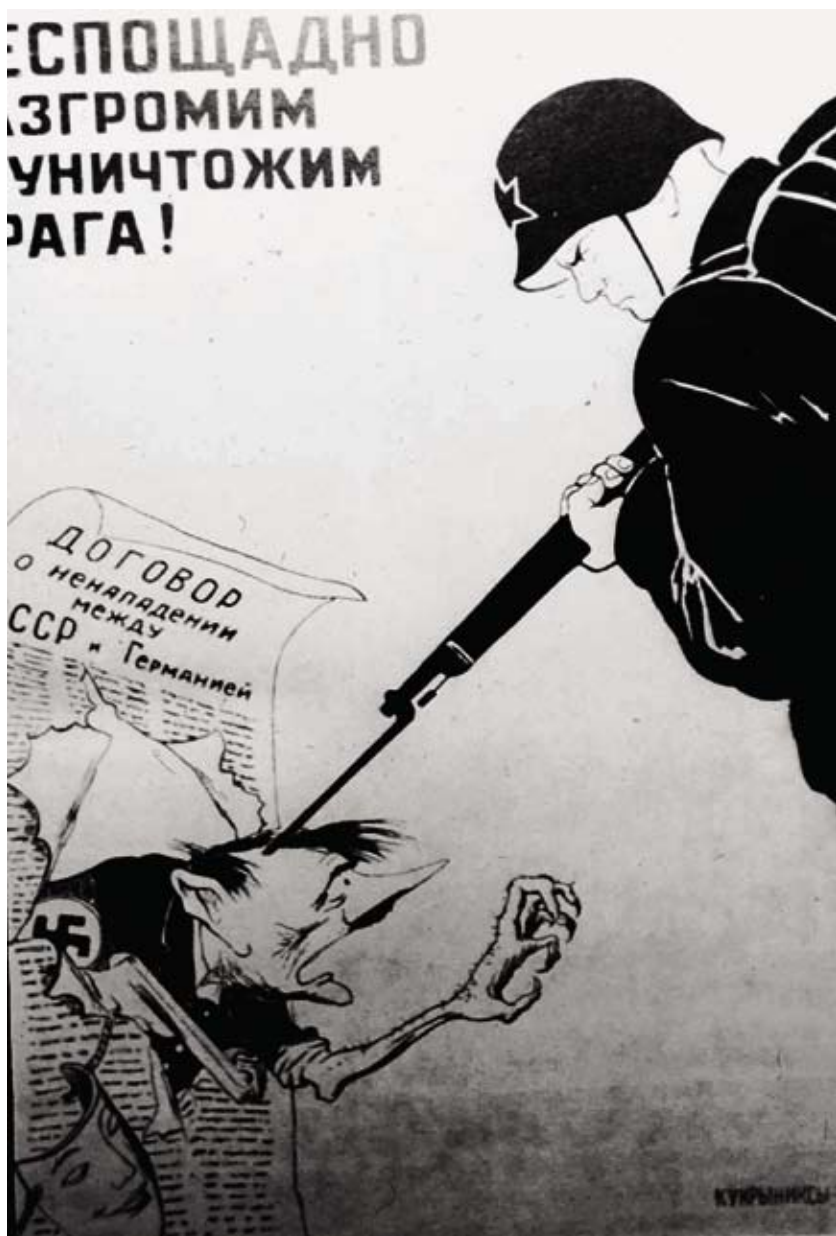
Sovětská karikatura obviňující Hitlera z porušení paktu o neútočení