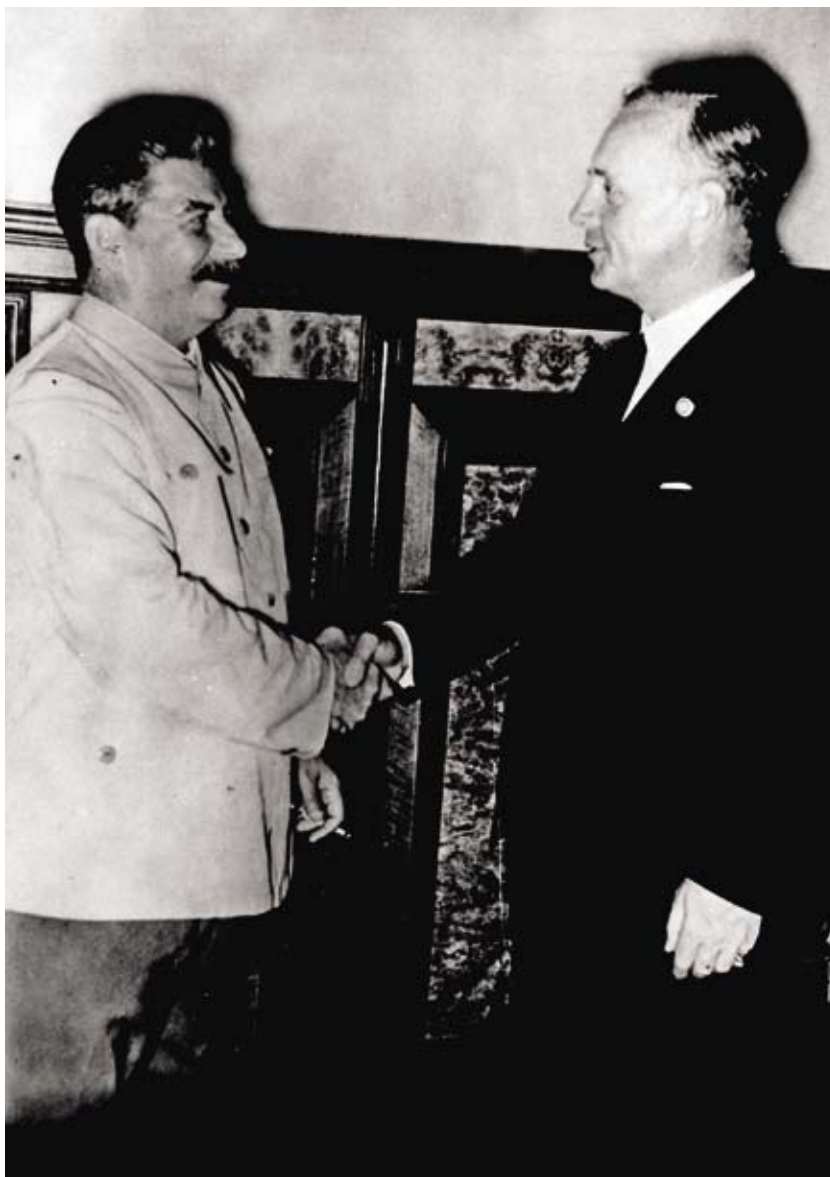
Stalin a Ribbentrop si vzájemně gratulují k uzavření paktu