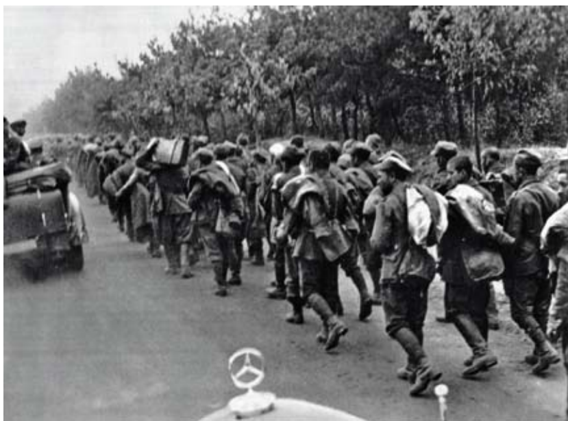
Polští vojáci na cestě do německého zajetí

Dodejme možná překvapivou informaci, že hospodářské kontakty mezi poválečným Německem (výmarským i hitlerovským) a Sovětským svazem v meziválečném období nebyly nikdy přerušeny, měly však svou vlastní