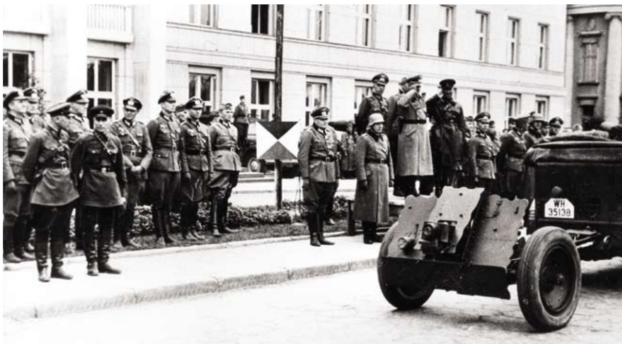
Společná sovětsko-německá vojenská přehlídka v Brestu Litevském 22. září 1939