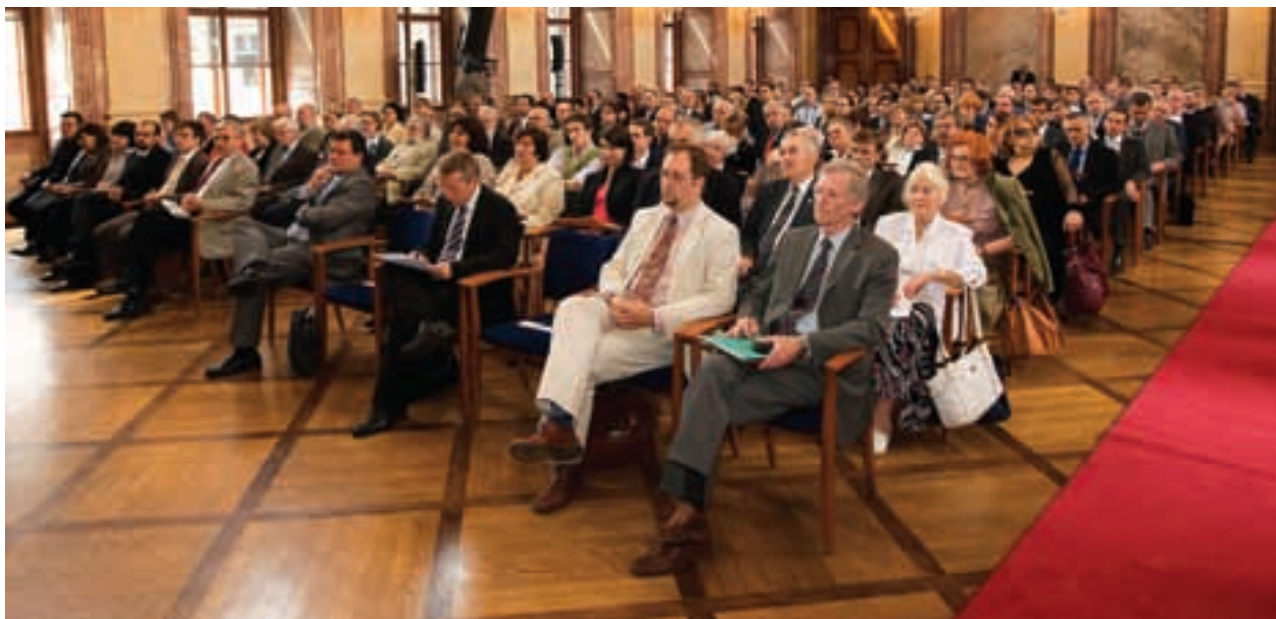
Vzpomínkový seminář sledoval zaplněný sál

Vždyť slovenský konzervativní politik František Mikloško dokonce