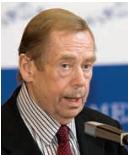
Václav Havel během svého příspěvku