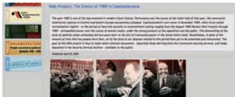
Anglická verze webu USTR

Webové stránky Ústavu navštívilo v loňském roce 205 907 zájemců, k 29. červnu letošního roku celkem 349 138. Na www.abscr.cz se v roce 2008 připojilo 131 167 uživatelů internetu, k letošnímu 29. červnu pak celkem 192 348.