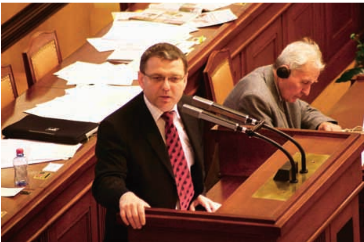
Lubomír Zaorálek za řečnickým pultem Sněmovny Parlamentu ČR