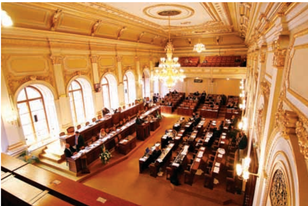
Poslanecká sněmovna Parlamentu České republiky