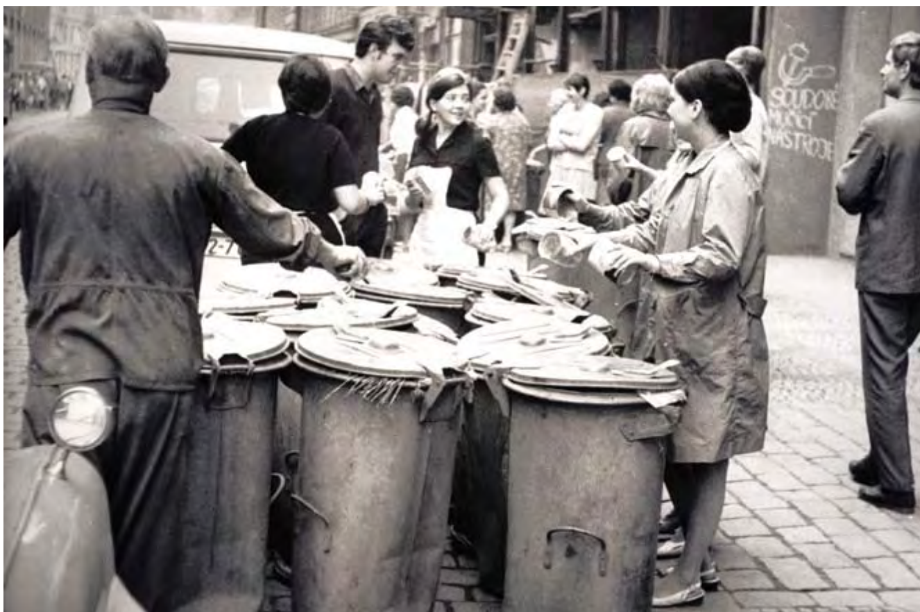
Generální stávká na protest proti okupaci