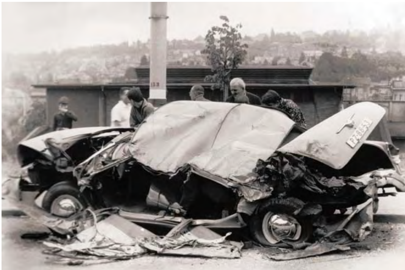
Léto 1968. Hromady šrotu a zborcených nadějí.