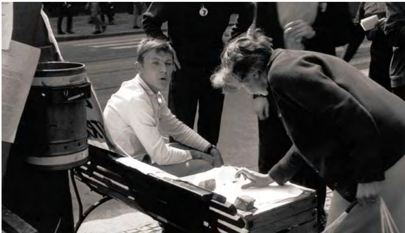
Podpisové akce samozřejmě vrcholily v srpnu 1968