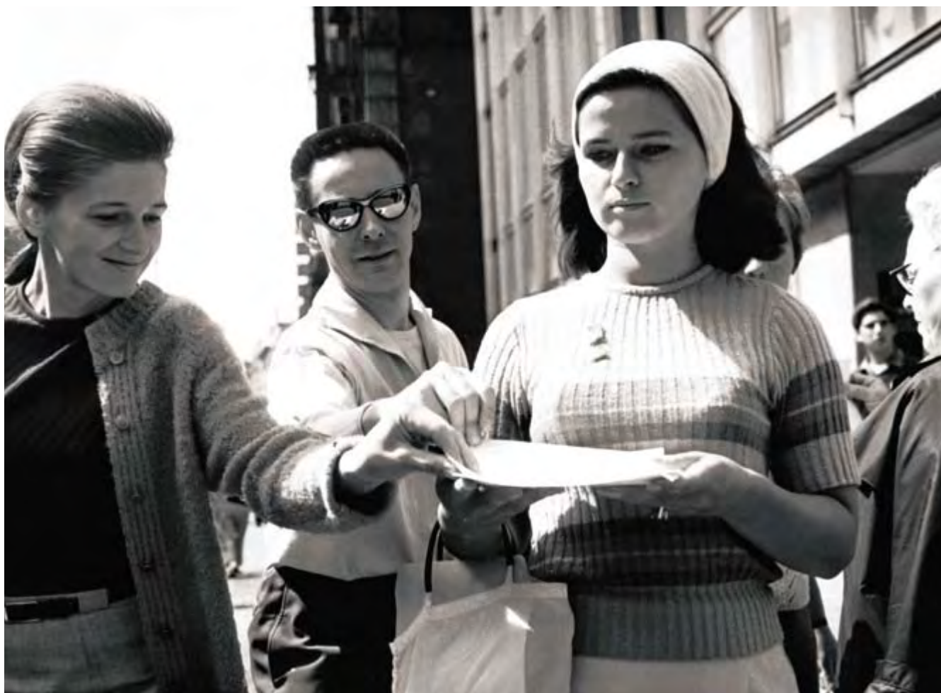
Petice, prohlášení, letáky... Jeden z typických jevů Pražského jara