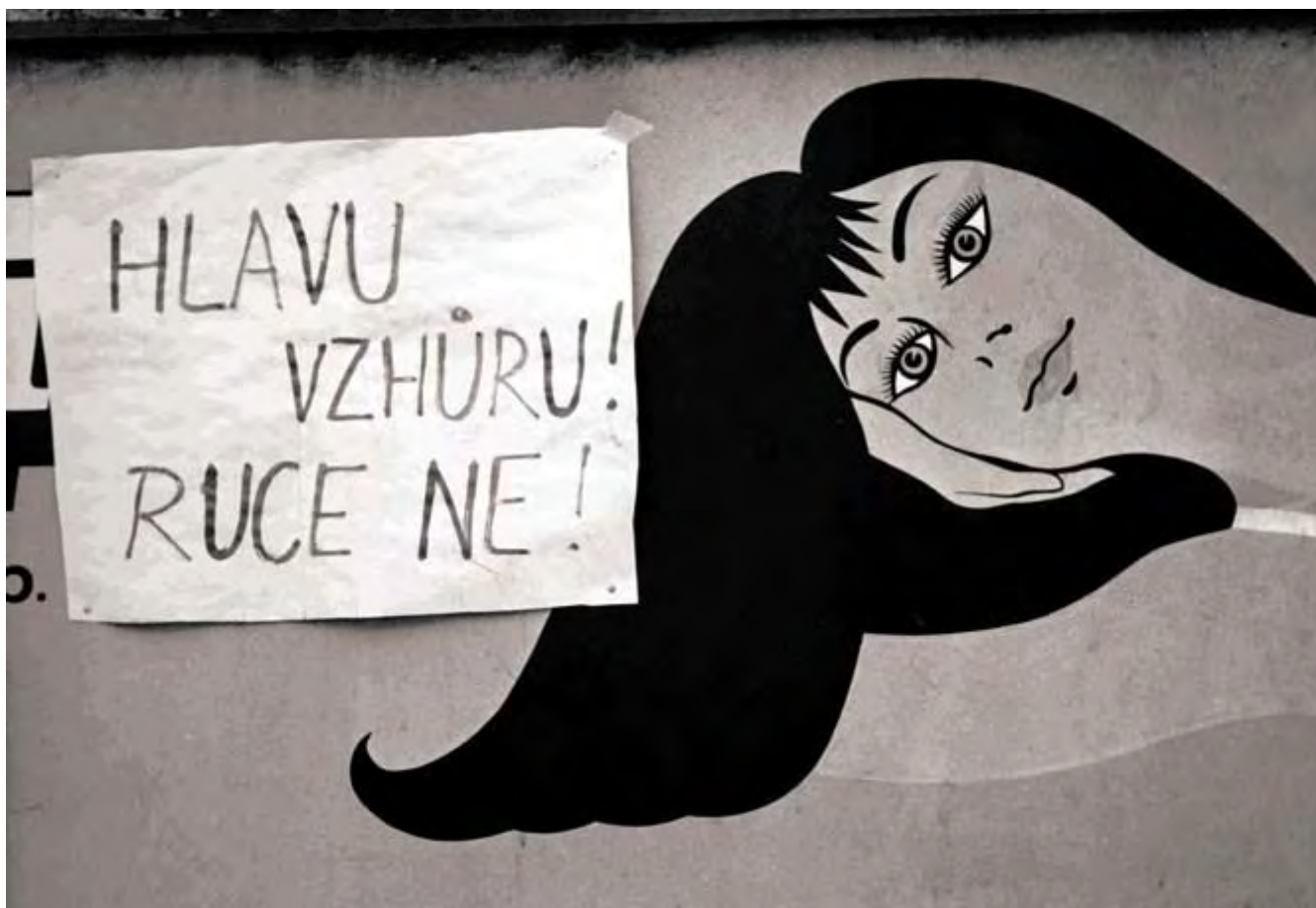
S okupací přibýlo také protestů