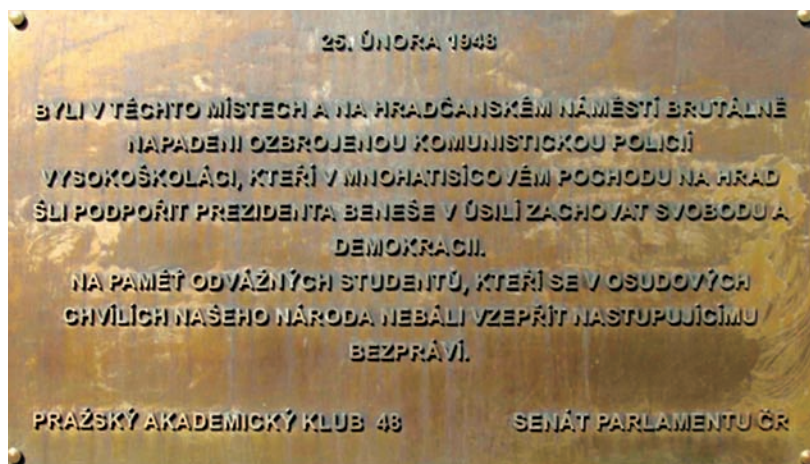
Fotografie pamětní desky v Nerudově ulici.

V pražské Nerudově ulici visí na zdi nenápadná pamětní deska. Před několika lety ji zde nechal ve spolupráci se Senátem Parlamentu ČR instalovat Pražský akademický klub 48, který sdružuje někdejší vysokoškolské studenty postižené z politických důvodů po roce 1948. Deska informuje o tom, že na těchto místech byla 25. února 1948 brutálně rozehnána studentská demonstrace. Její účastníci tehdy přišli bez úspěchu vyzvat prezidenta Edvarda Beneše, aby nepodleh nátlaku komunistů.