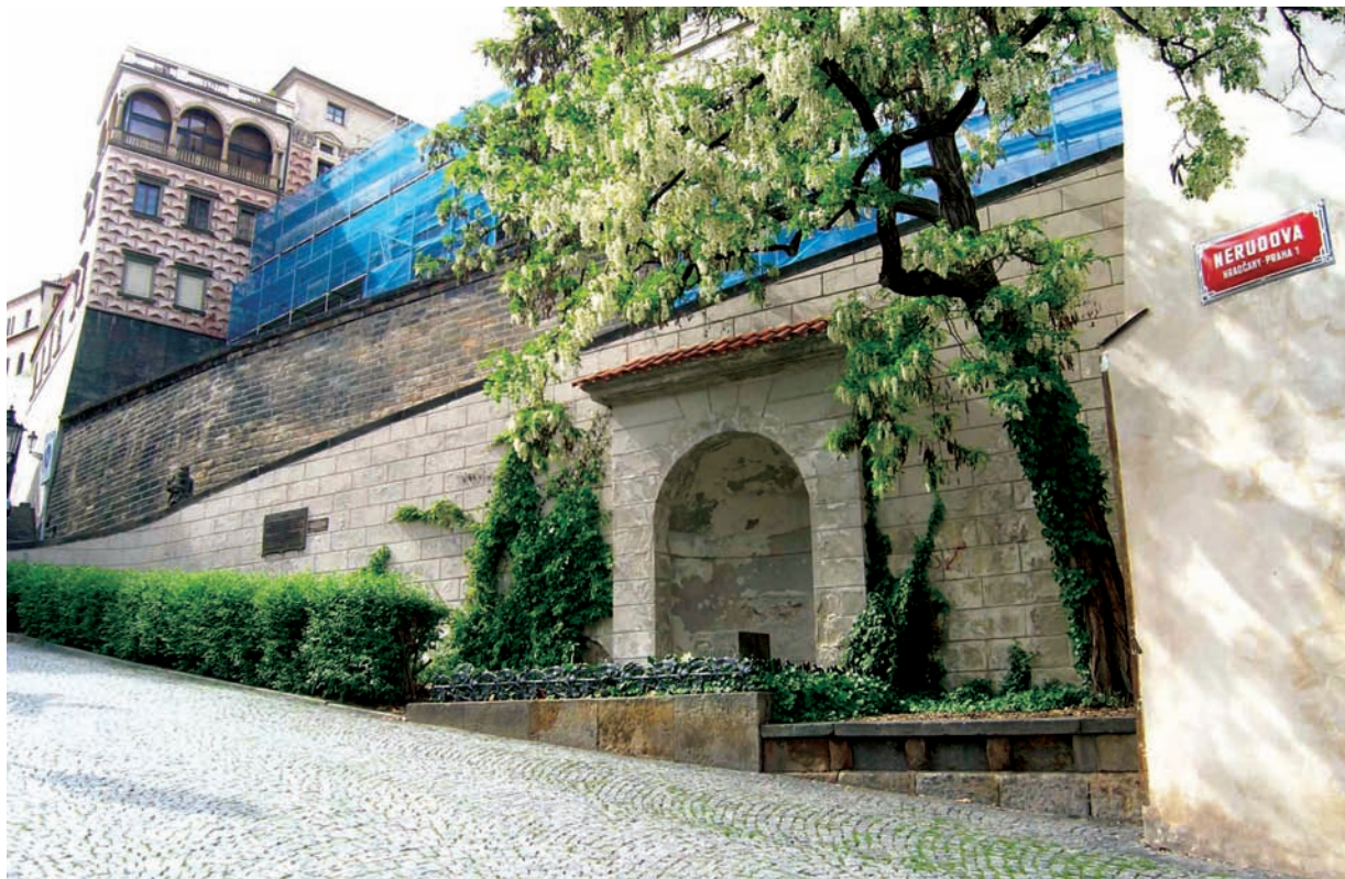
Fotografie pamětní desky v Nerudově ulici.

hovoří o třech tisících, pamětníci uvádějí až několikanásobně větší počet, a naopak podle historika SNB Vlastislava Kroupy se průvodu účastnilo pouze 500 osob 4 ) ode-