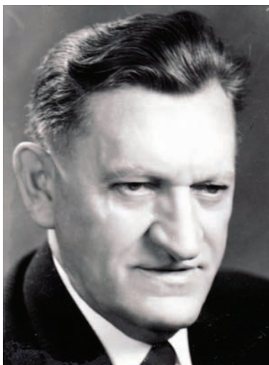
Kampaň odstartoval ministr vnitra Jan Pelnář.

První z dokumentů byl datován k 18. srpnu 1954, podle formulace byl pracovním podkladem k poradě vedení anglické rozvědky. Skutečně obsahoval teoretický plán dlouhodobého postupu vůči zemím sovětského bloku, jehož úkolem bylo využít slabostí a třenice ve vyšších kruzích zemí sovětského bloku . 7 Dokument byl spíše teoretickou studií o metodách vlivové rozvědné práce než plánem konkrétní zpravodajské akce. Operace měla být založena na dlouhodobé analýze a následném využívání všech možných slabých míst v Sovětském svazu a jeho satelitech. Československo jakožto cílová země nebylo v dokumentu vůbec zmíněno. Ostatní čtyři dokumenty byly již konkrétnější. Pocházely z let 1958–1961. Obsahovaly komentáře britské rozvědky ke vztahům Sovětského svazu s jednou ze